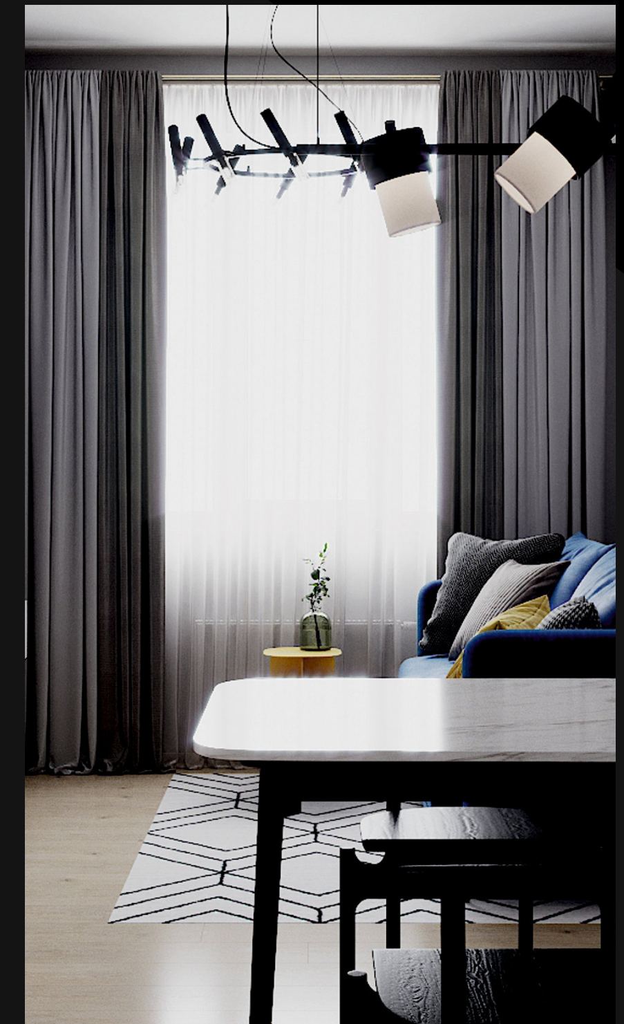
Продуманные прогрессивные планировки