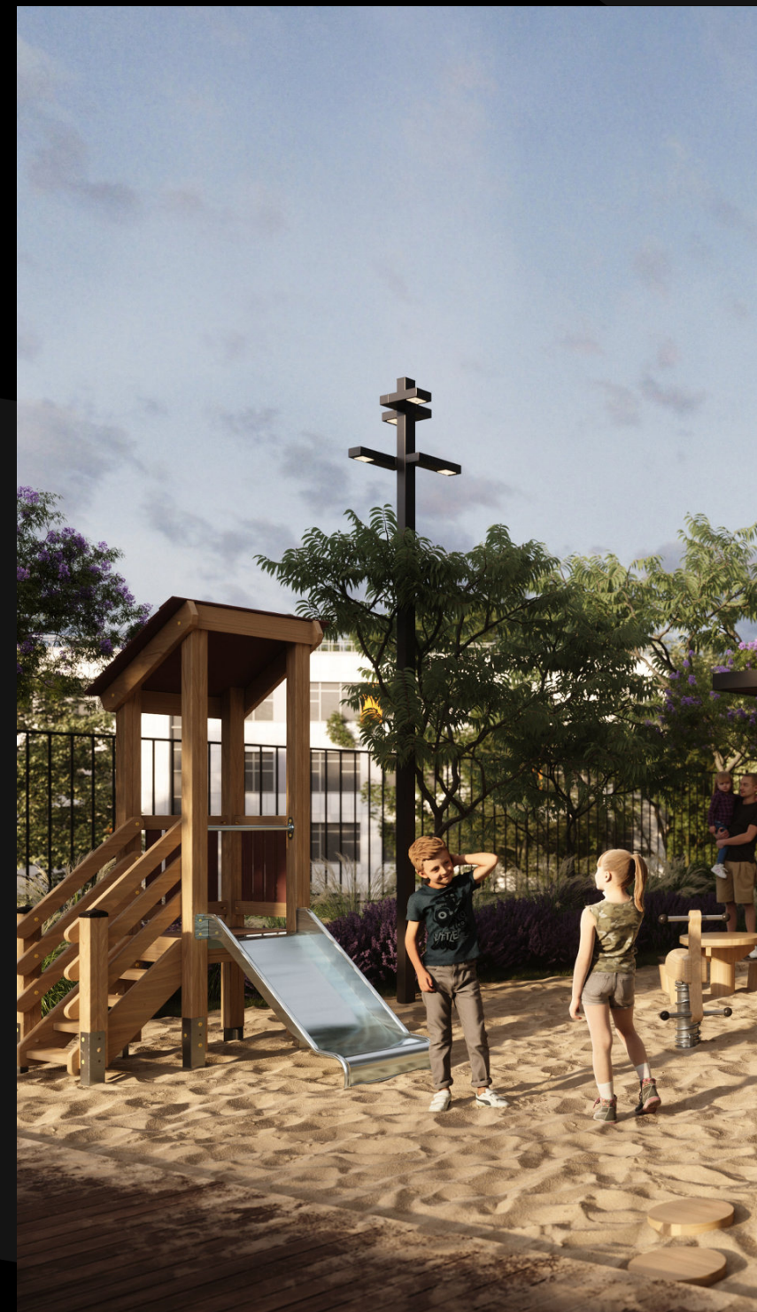
Парковое благоустройство двора: игровые площадки для детей по возрасту, релакс-пространства с лежаками, спортивные work-out-зоны, водные объекты