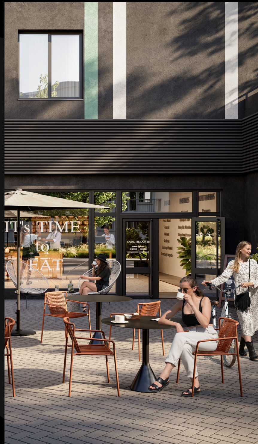
Востребованные, развитые локации