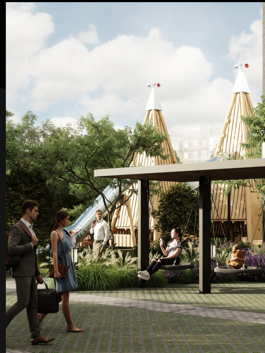
Закрытый, безопасный двор без машин и посторонних