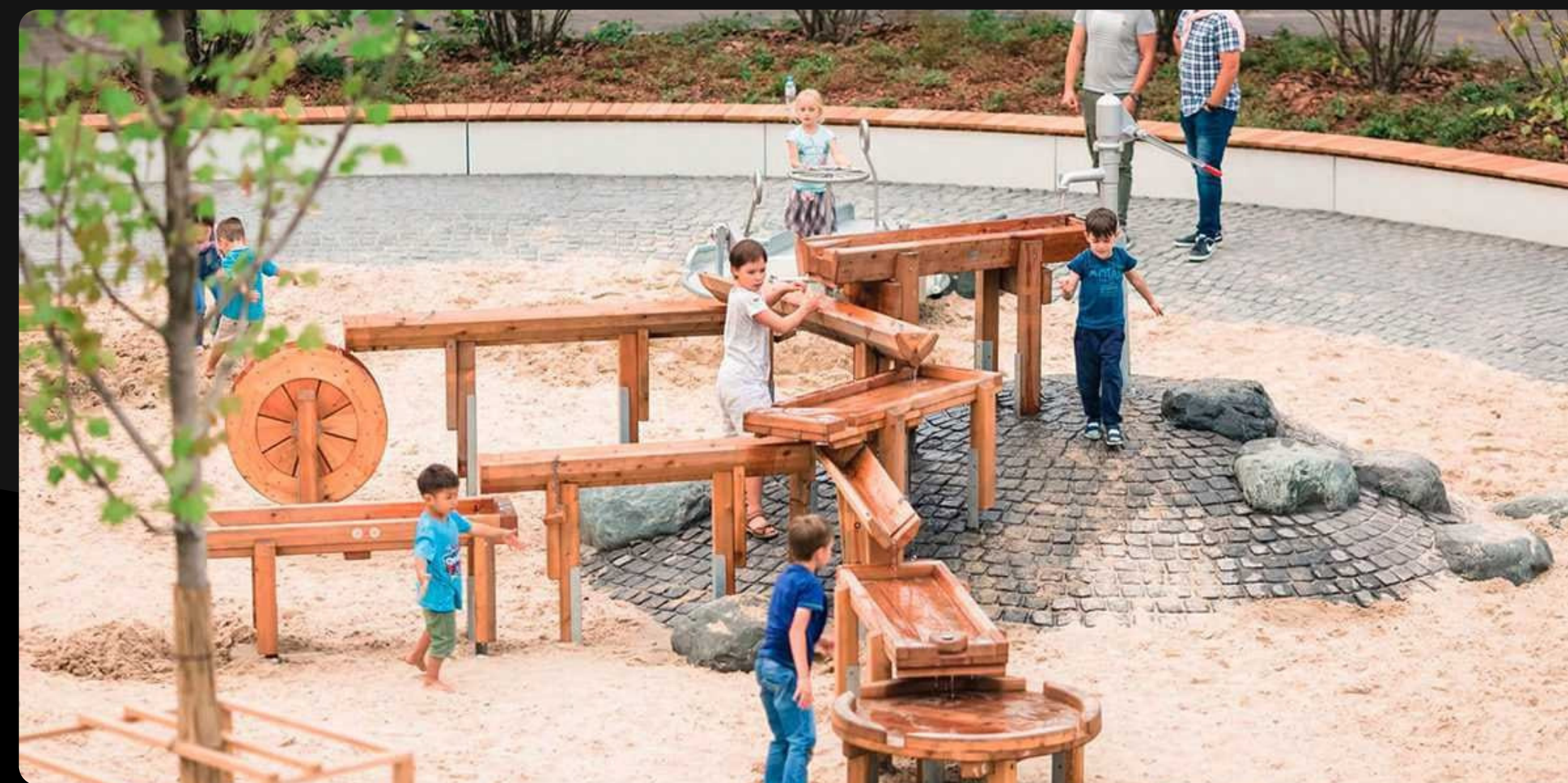
Москва. Парк Горького