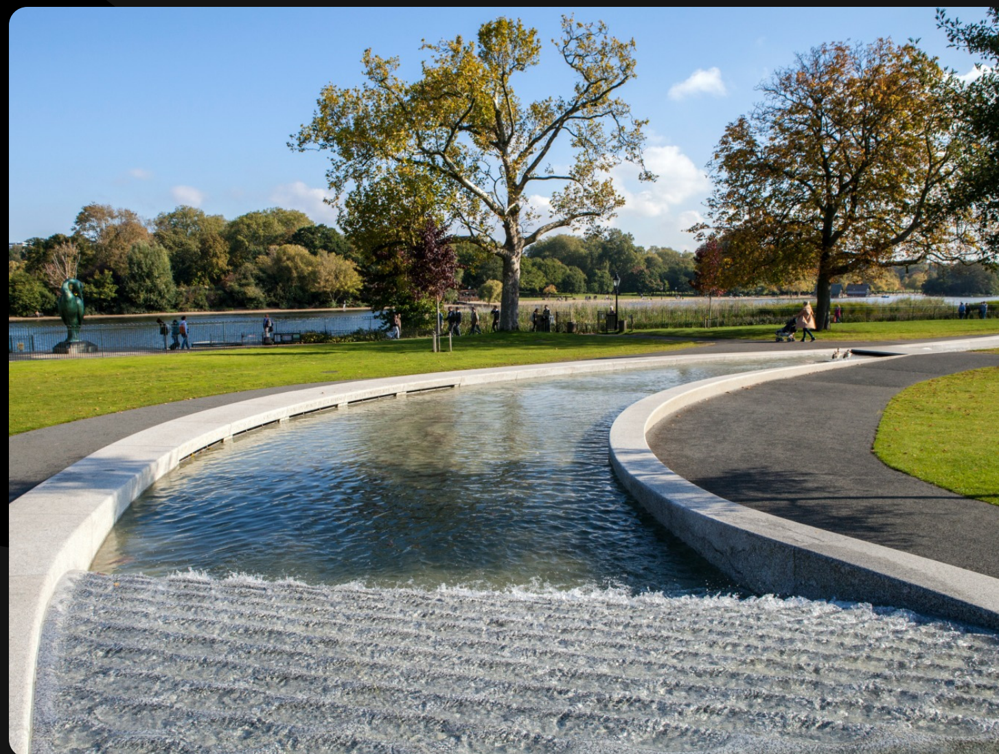
Лондон. Фонтан принцессы Дианы в Гайд-парке