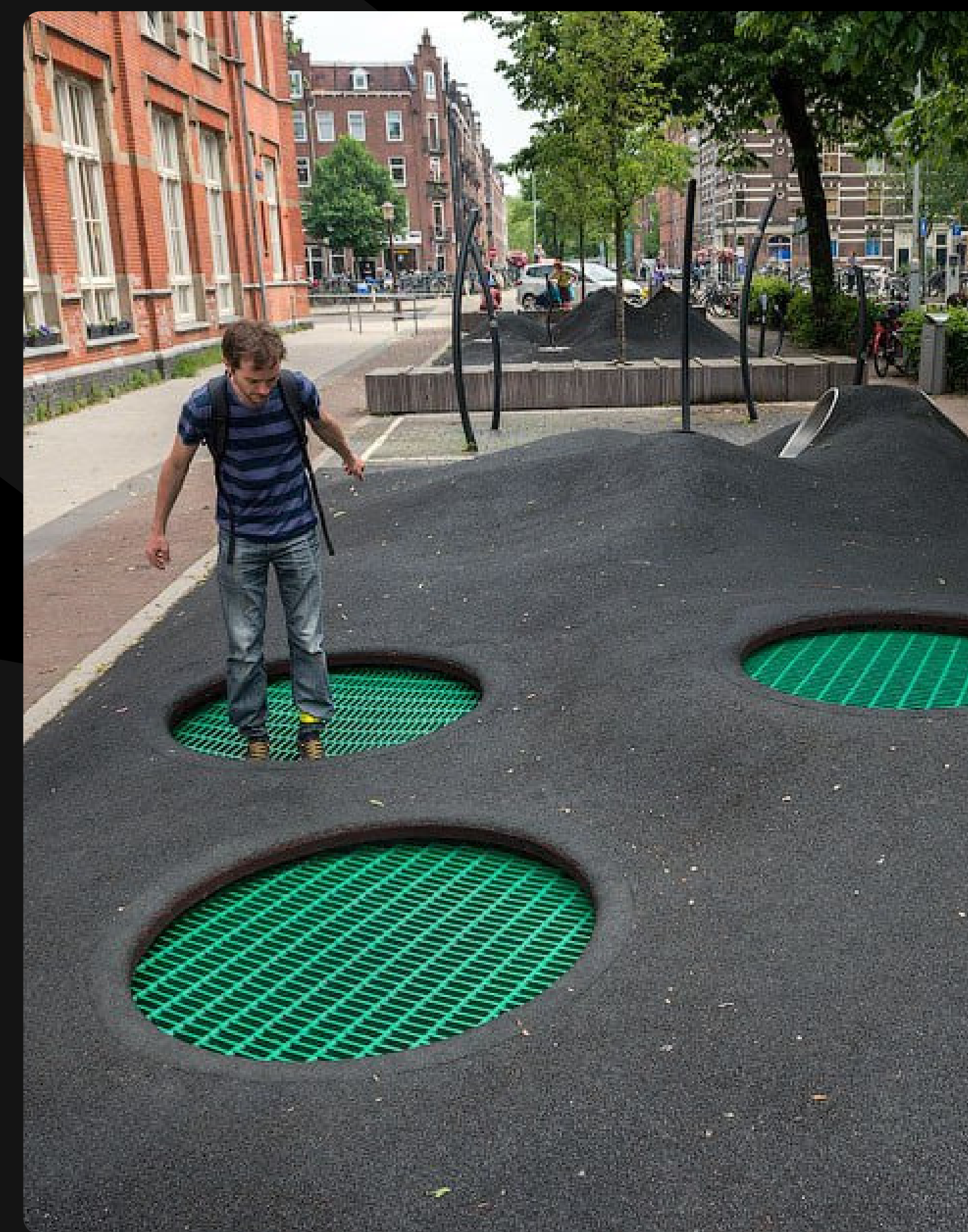
Амстердам. Площадка на пешеходной улице