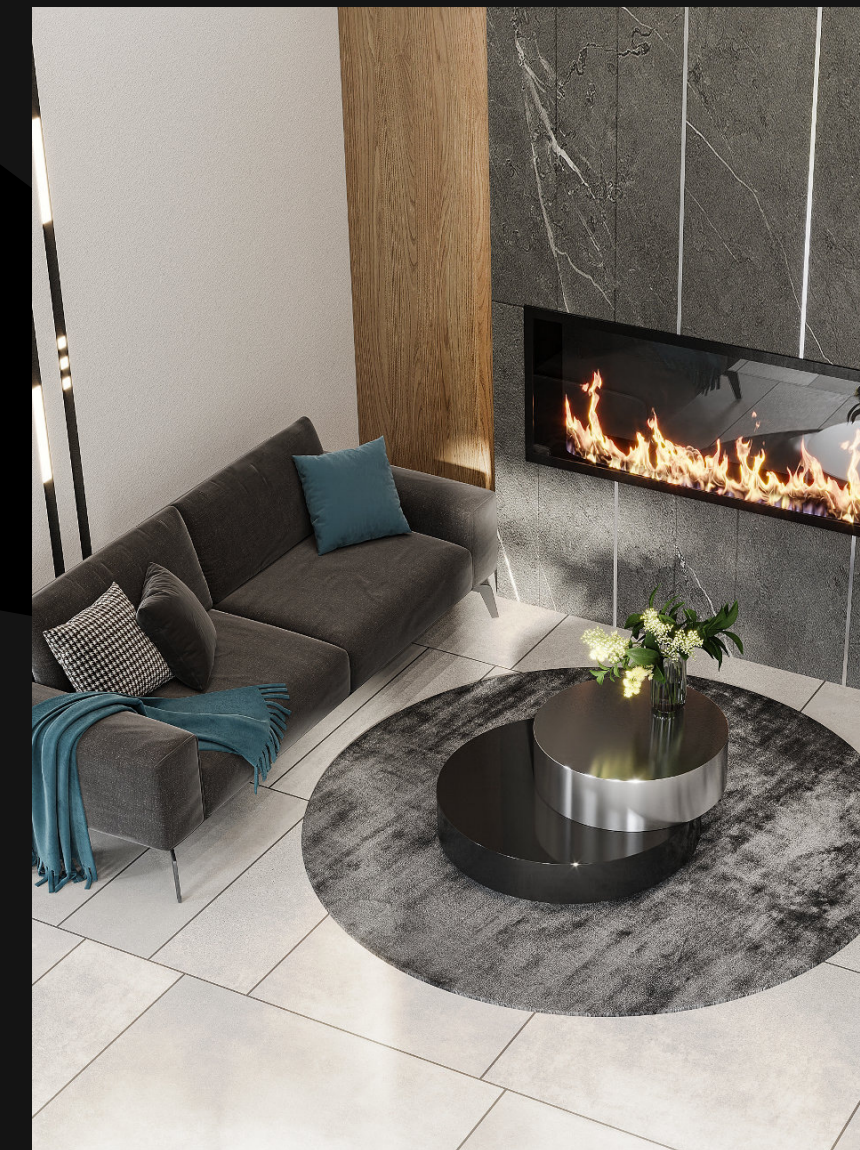
Дизайнерские холлы с камином и мягкой мебелью в зоне ожидания