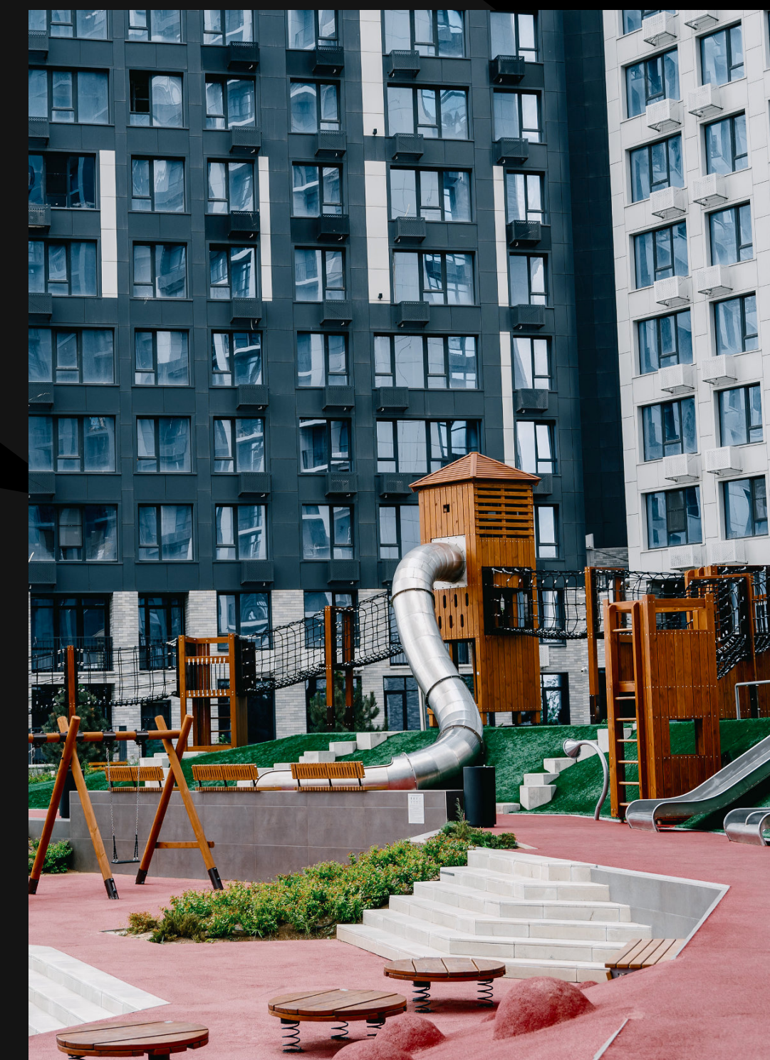
Сегодня дворы превращаются в общественные центры