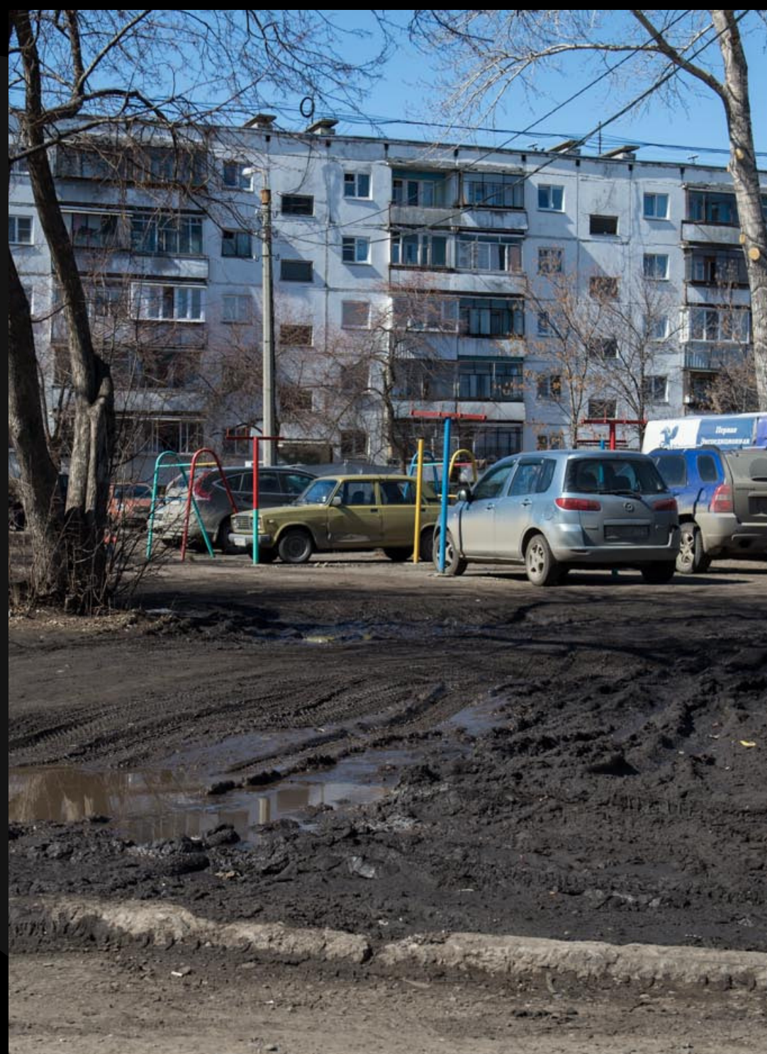
Спартанские условия нулевых