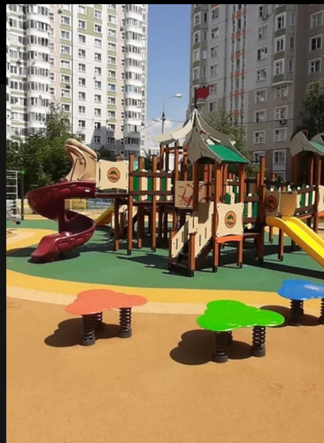
Концепция 2000-х «двор без машин»