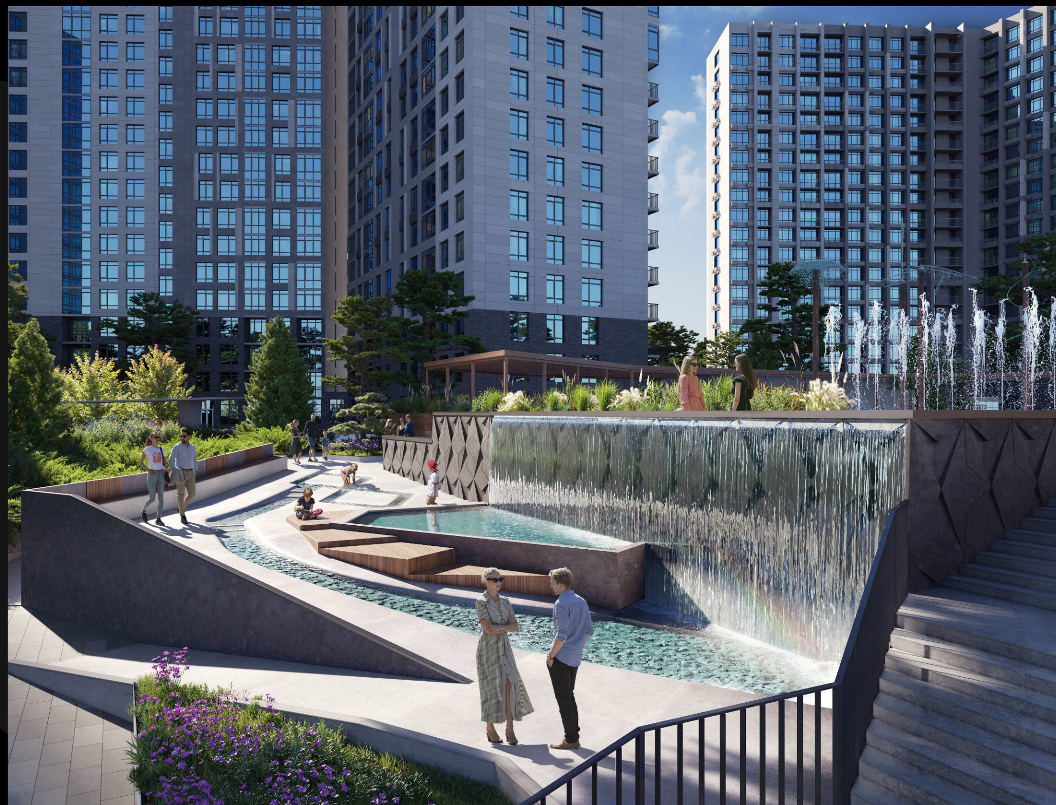
«Атмосфера». Долина водопадов