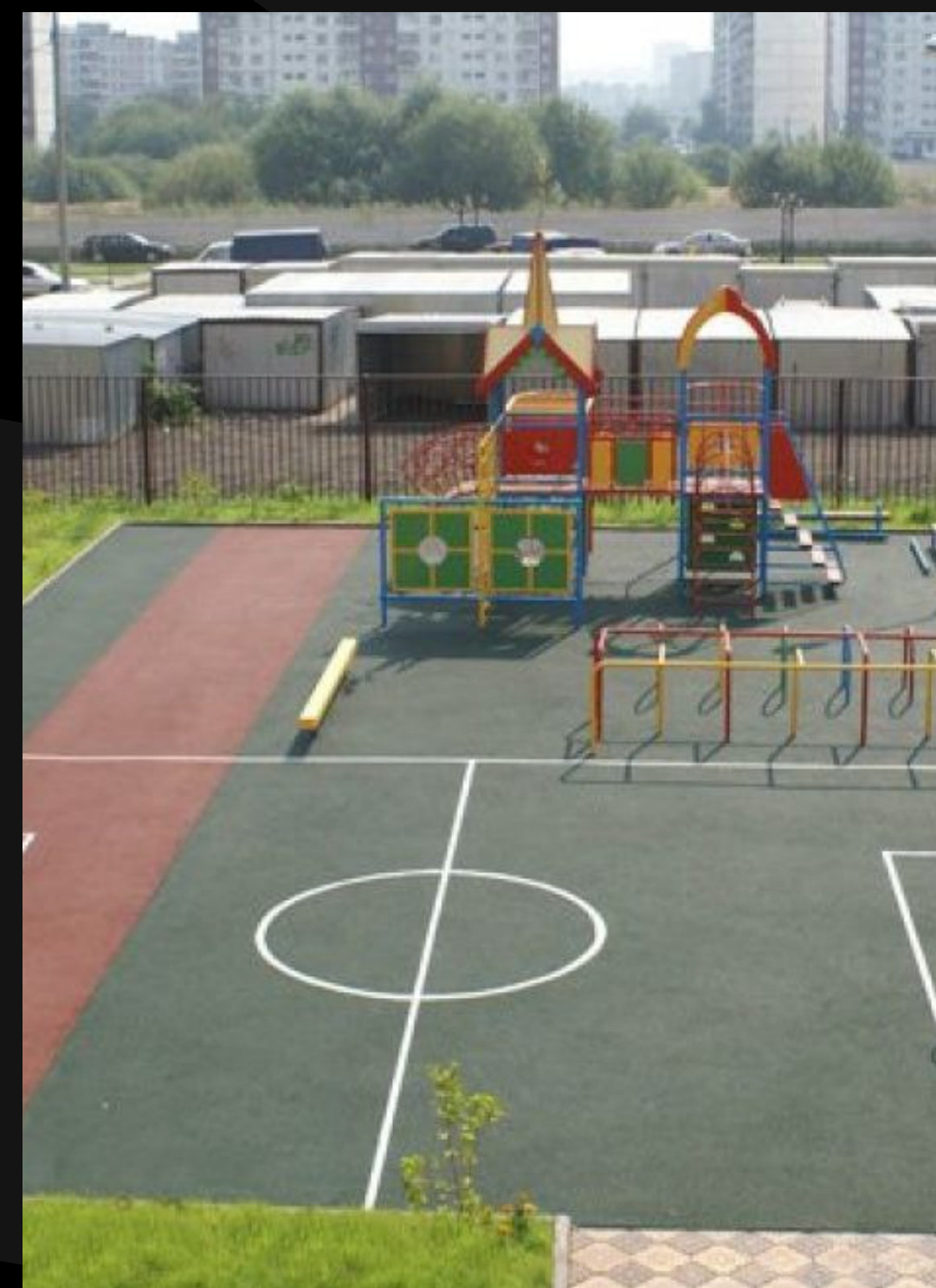
2010-е – наполнение дворов расширилось до детских и спортивных площадок