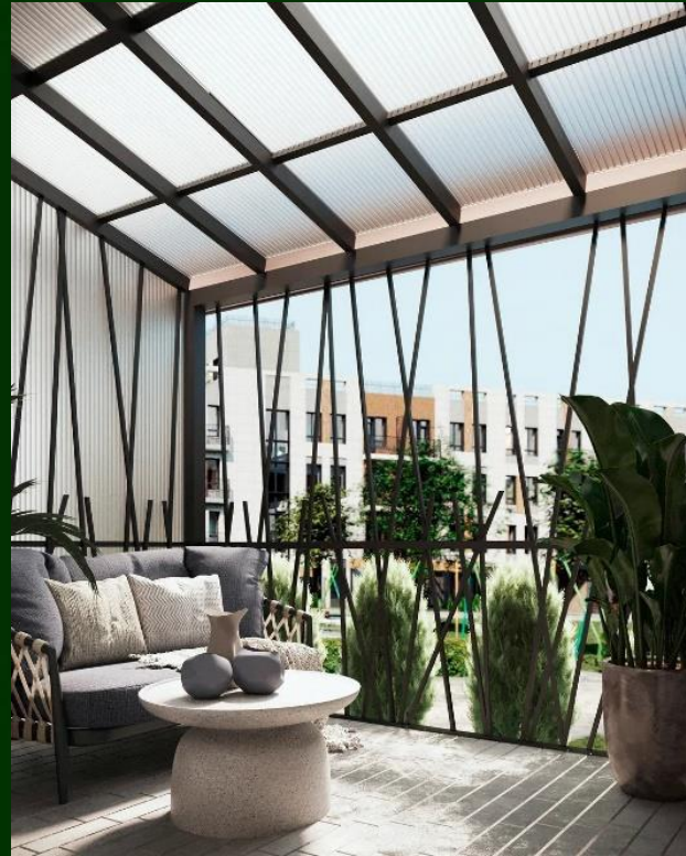
Квартиры с террасами на 1м этаже (патио)