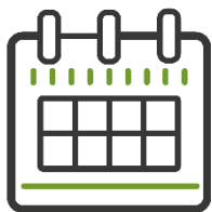
Дата проведения аукциона