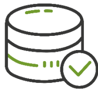
Начальная стоимость лота

https://utp.sberbank-ast.ru/VIP/NBT/PurchaseView/43/0/0/1017514