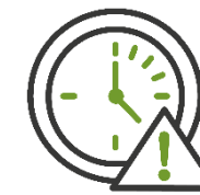
Дата окончания приема заявок