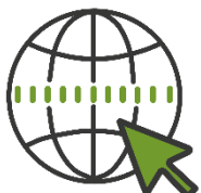
Ссылка на ЭТП

https://utp.sberbank-ast.ru/VIP/NBT/PurchaseView/43/0/0/1017514