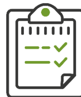
Запрос дополнительной информации