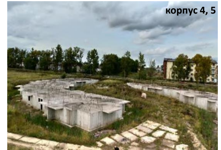
корпус 4, 5