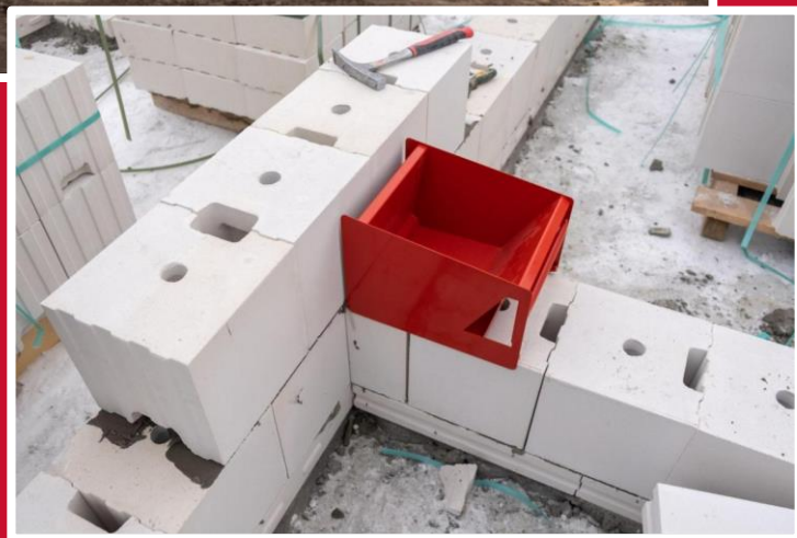
БЛОКИ НЕСУЩИХ И САМОНЕСУЩИХ СТЕН