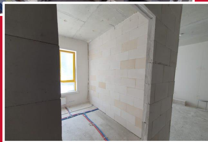
БЛОКИ ПЕРЕГОРОДОЧНЫХ СТЕН