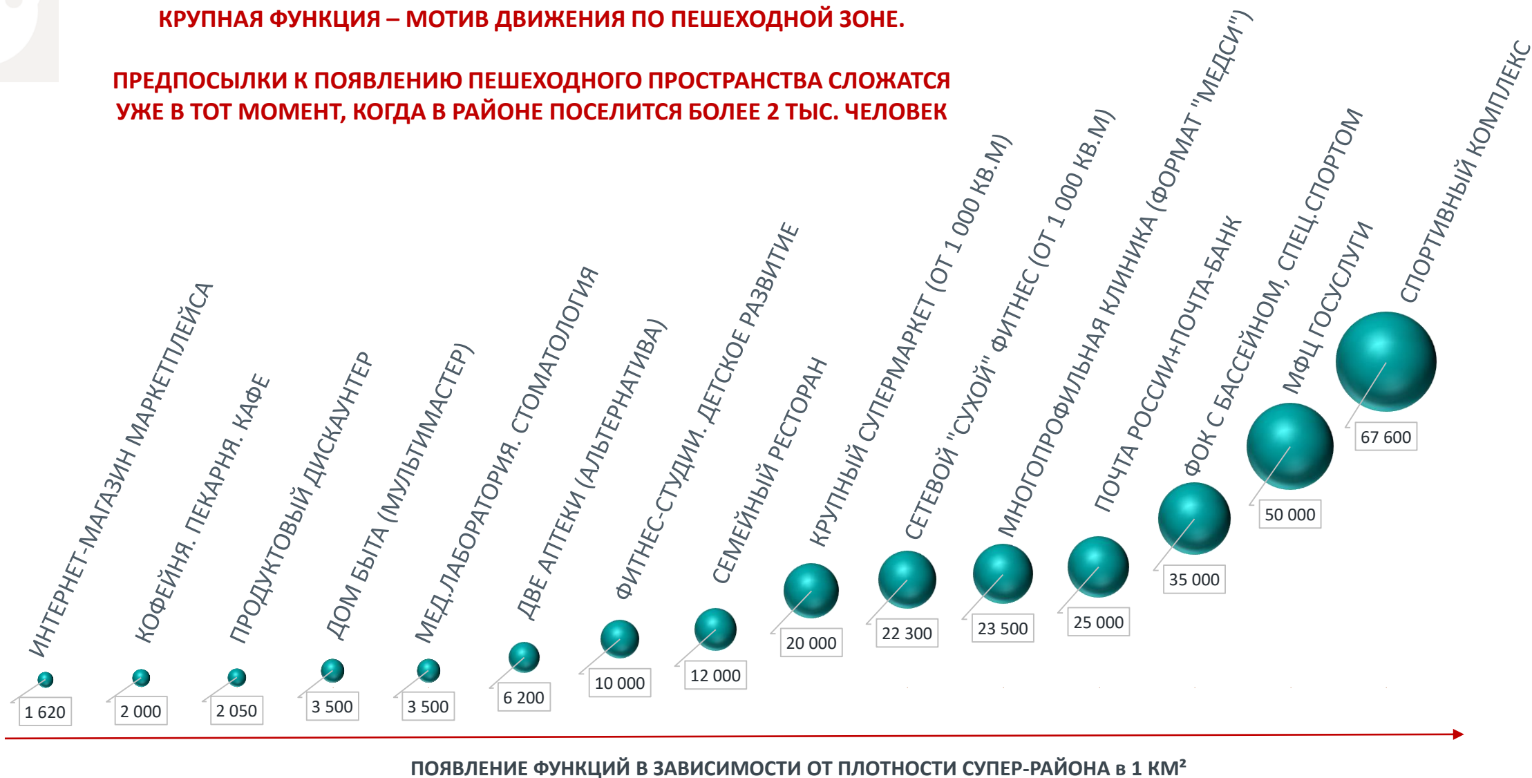
ПОЯВЛЕНИЕ ФУНКЦИЙ В ЗАВИСИМОСТИ ОТ ПЛОТНОСТИ СУПЕР-РАЙОНА в 1 км²

ПРЕДПОСЫЛКИ К ПОЯВЛЕНИЮ ПЕШЕХОДНОГО ПРОСТРАНСТВА СЛОЖАТСЯ УЖЕ В ТОТ МОМЕНТ, КОГДА В РАЙОНЕ ПОСЕЛИТСЯ БОЛЕЕ 2 ТЫС. ЧЕЛОВЕК